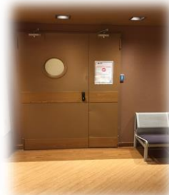
Τμήμα Μονώσεων- Είσοδος με κωδικό