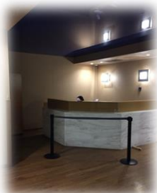
Είσοδος & Ανελκυστήρας για πιθανά κρούσματα