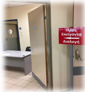
1 ο Triage-ΤΕΠ