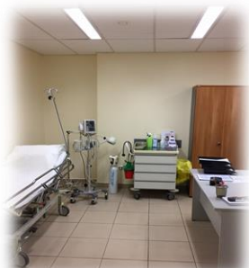
2 ο Triage-ΤΕΠ