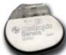
Νέα Σειρά Sensia Completely Automatic