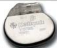
Νέα Σειρά Versa Completely Automatic

Βηματοδοτικά Ηλεκτρόδια Capsure Z Novus CapsureFix