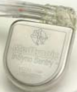
Insync Sentry-35J CRT-ICD