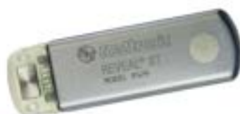
Νέα Εμφυτεύσιμα Holter Reveal XT Reveal DX