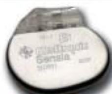
Νέα Σειρά Sensia Completely Automatic