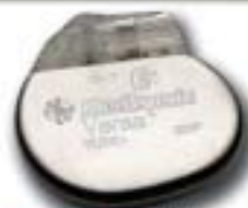
Νέα Σειρά Versa Completely Automatic

Βηματοδοτικά Ηλεκτρόδια Capsure Z Novus CapsureFix